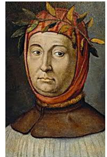
Francesco Petrarca, 1304-1374 (Bild gemeinfrei)